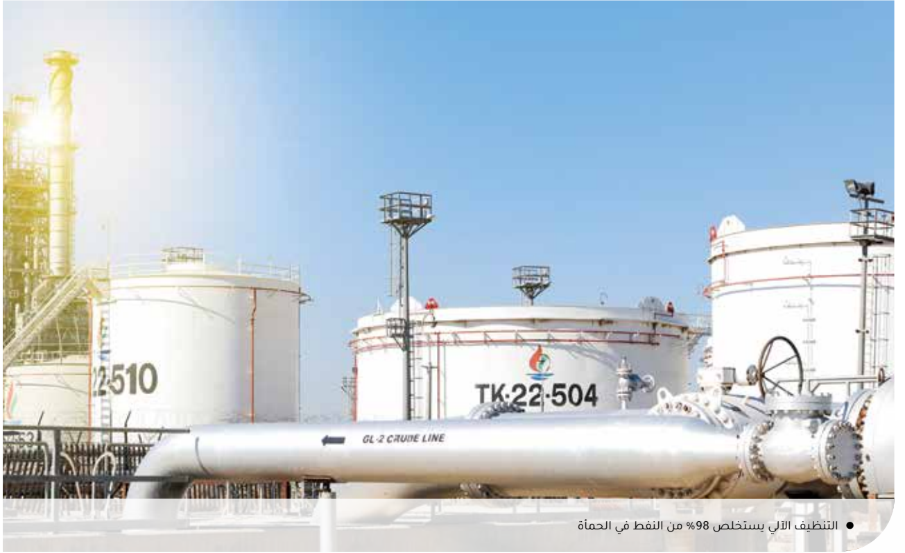
● التنظيف الآلي يستخلص 98% من النفط في الحمأة

المُصاحبة لعملية الصيانة. فإن خيار "ميكنة" العملية يأتي كحل أمثل آمن وفعال وصديق للبيئة، وهو ما يُساعد على تقليل أوقات توقف عمل الخزانات، دون الحاجة إلى زيادة في التكلفة على الممارسات الحالية. بل وتحقق هذه العملية نسبة مرتفعة في استخلاص النفط من الحمأة تصل إلى 98%.