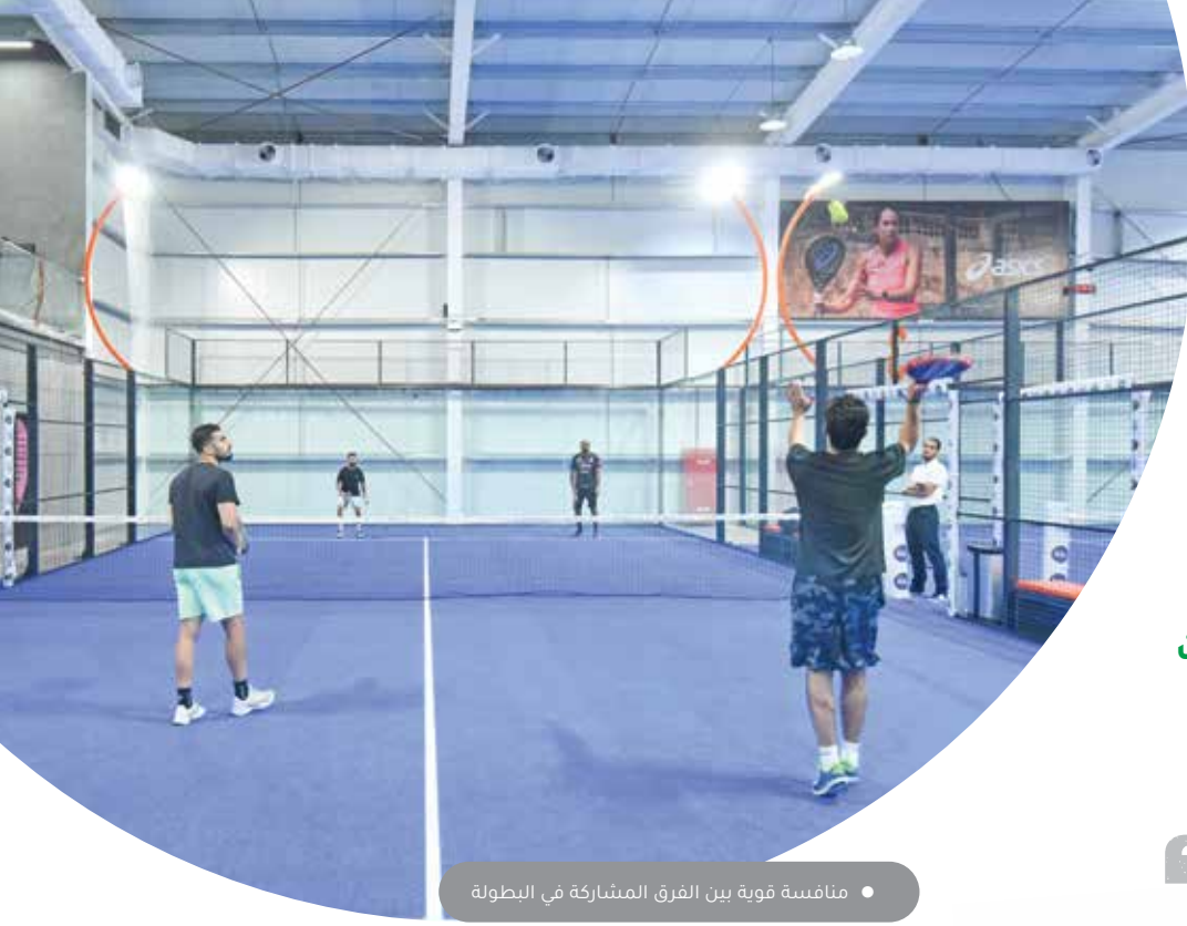
• منافسة قوية بين الفرق المشاركة في البطولة