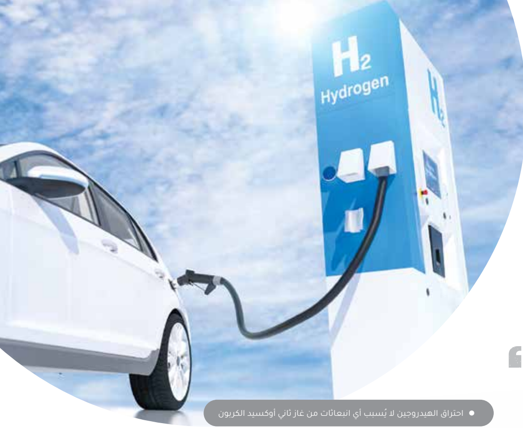
• احتراق الهيدروجين لا يُسبب أي انبعاثات من غاز ثاني أكسيد الكربون