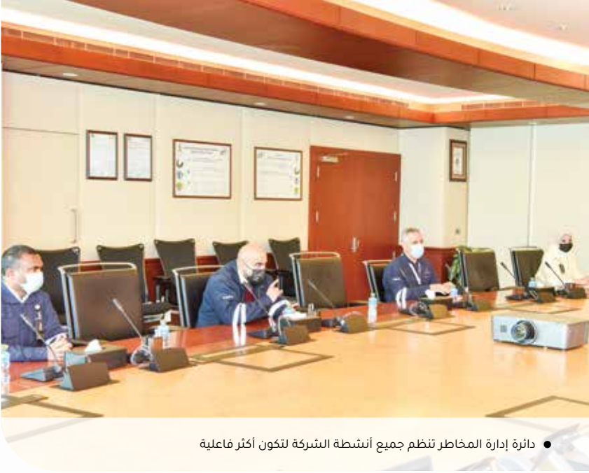
● دائرة إدارة المخاطر تنظم جميع أنشطة الشركة لتكون أكثر فاعلية