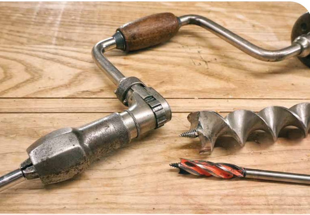
● عام 1889 شهد تسجيل براءة اختراع أول مثقاب يدوي