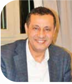
بقلم: د. أمين بدير القسم الطبي - دائرة الصحة والسلامة والبيئة

وبالإضافة إلى الأبعاد المادية التي تشمل: الحركة، والنوم، والأكل، والتنفس، والشم، يتميز الإنسان ببعد آخر يتكون من العواطف والأفكار والخيال.. إنها النفس التي تتماسك بالحب للخالق عز وجل، والناس، والذات، وتهوي مريضة إذا مات هذا الحب بين خلاياها، ومن ثم فإن العامل النفسي له أهمية كبيرة في الصحة العقلية والجسدية.