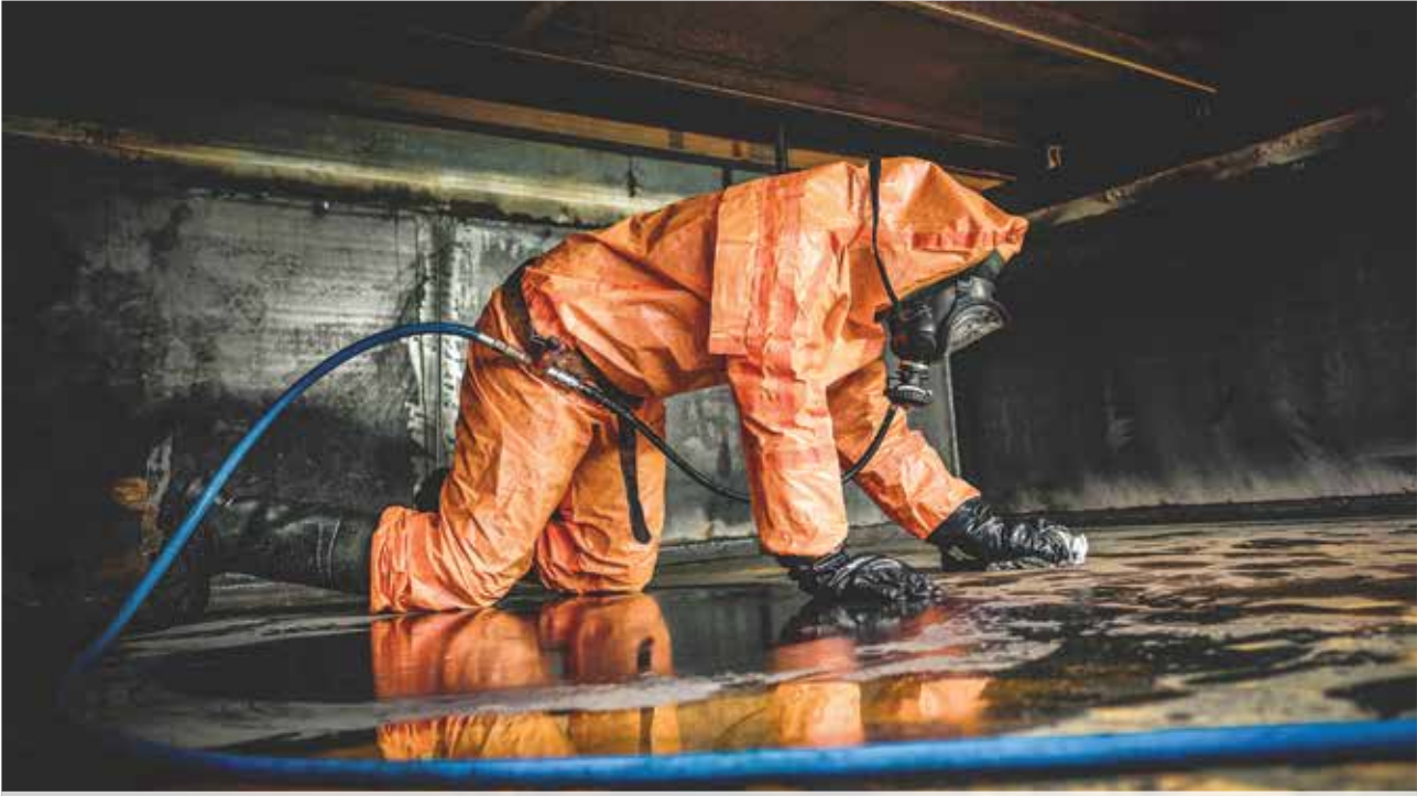
• نتائج عملية التنظيف اليدوي لا تكون بالكفاءة المطلوبة