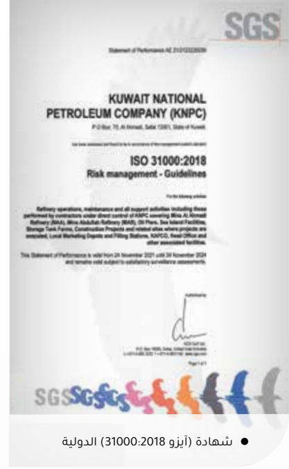
● شهادة (أيزو 31000:2018) الدولية

هذه الشهادة المستحقة التي تؤكد على مواعمة وثائق إدارة المخاطر في "البتروال الوطنية" واعتمادها الممارسات وفقاً للمواصفة القياسية الدولية (أيزو 31000:2018)، ومُساعدة الشركة في دمج إدارة المخاطر بأنشطتها ووظائفها، بما في ذلك عملية اتخاذ القرار، مشيرة إلى أن هذه الشهادة تضاف إلى رصيد الشركة المتميز في إدارة المخاطر بجميع مواقعها.