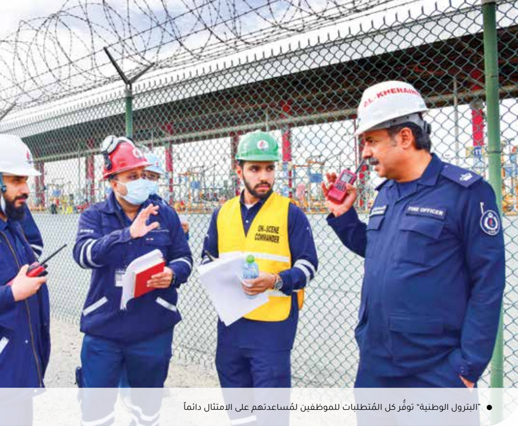
● "البتروال الوطنية" توفر كل المتطلبات للموظفين لمساعدتهم على الامتثال دائماً