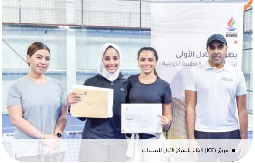
● فريق (ICE) الفائز بالمركز الأول للسيدات

ونظراً لشدة المنافسة في المباراة النهائية وعدم حسم الفريق الفائز، تمّ تمديد الوقت ولعب أشواط إضافية، وهو ما اضطر اللجنة المنظمة إلى تكملة المباراة في ملعب خارجي غير مكيف، إلا أن ذلك لم يقلل من شدة المنافسة، واستمرت النتائج متقاربة إلى أن حصل فريق (SSS PADEL) على النقطة الأخيرة ليعلن الحكم فوزه بالبطولة.