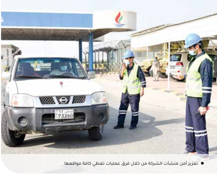
● تعزيز أمن منشآت الشركة من خلال فرق عمليات تغطي كافة مواقعها