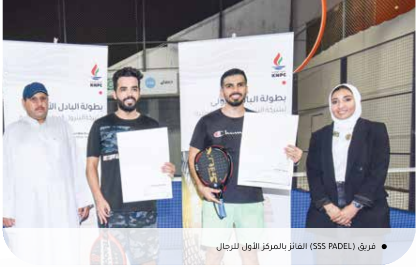
● فريق (SSS PADEL) الفائز بالمركز الأول للرجال

بتحكيمها في لعبة البادل، وكذلك في التنس الأرضي“.