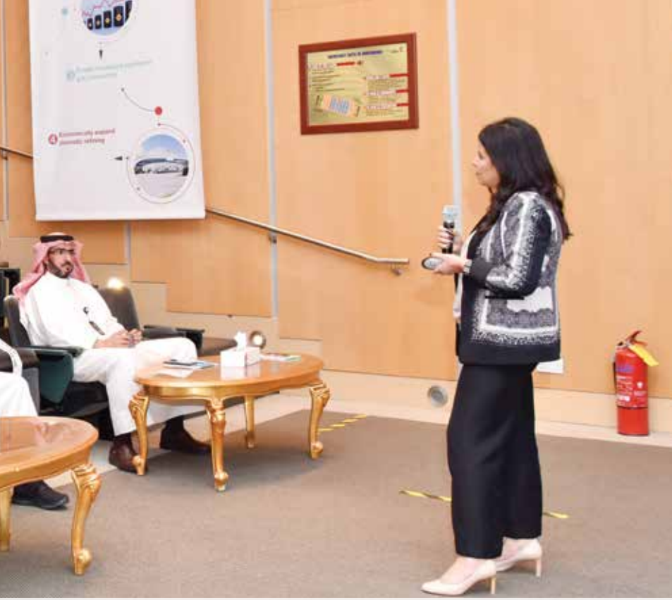
● اهتمام من الحضور بمعرفة أهمية العلامة التجارية وتأثيراتها على الشركة