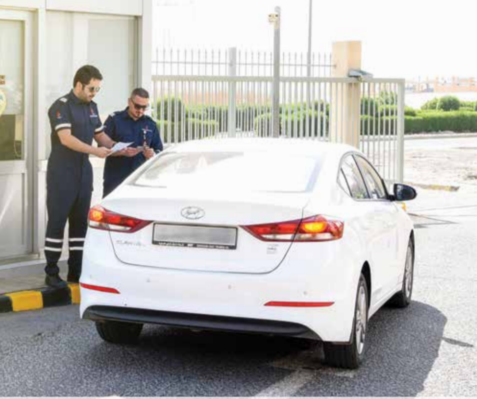
● رجل الأمن واجهة الشركة ويجب أن يتعامل بشكل جيد مع الآخرين

” 331 متدرباً من موظفي الدائرة شاركوا في الدورة بنسبة حضور 77 %